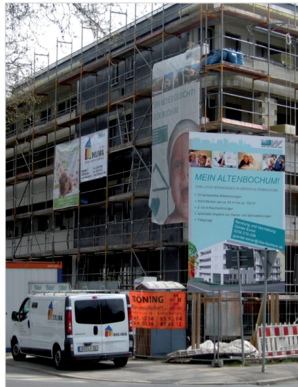
Abbildung 2: VBW-Bochum veranlasste in 2013 ein Auftragsvolumen für Neubau Bestandswohnungen und Bauträgergeschäft, Modernisierungen und Instandsetzungen von mehreren Mio. Euro

Der Aufwand für die Buchhaltung wird nun im Unternehmen komplexer. Bisher wurden für die Einkäufe und bezogenen Leistungen die eingegangenen Rechnungen entsprechend als Verbindlichkeit gegenüber dem Kreditor gebucht, die Vor-